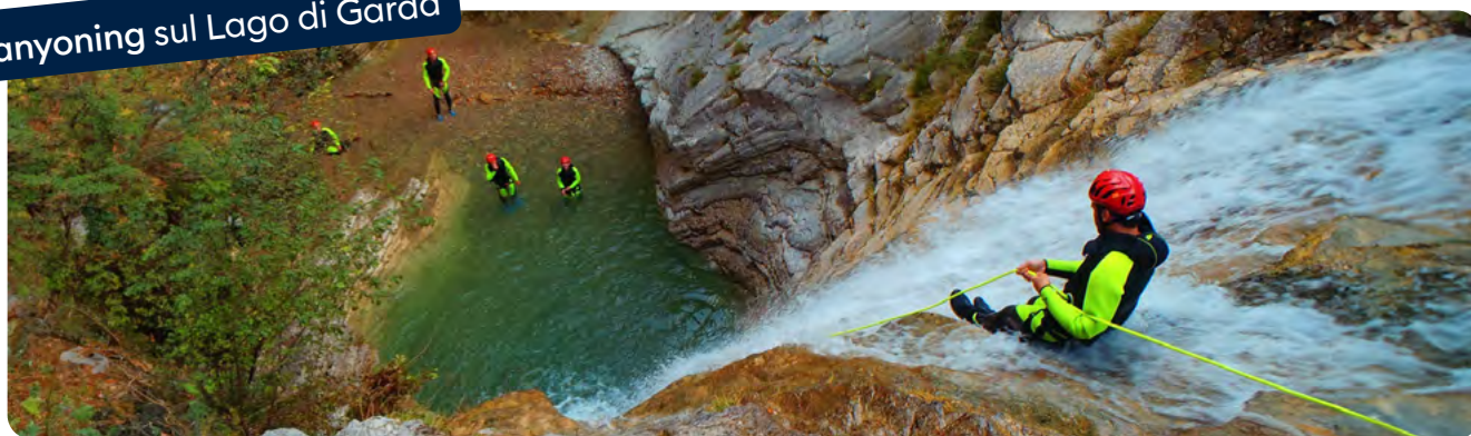
Canyoning sul Lago di Garda

Tra gli indicatori del dominio Salute vi è quello dell'eccesso di peso che per il 2023 registra, in lieve aumento rispetto al 2021 e al 2022, un valore del 44,6 per cento sul totale della popolazione maggiore di 18 anni.