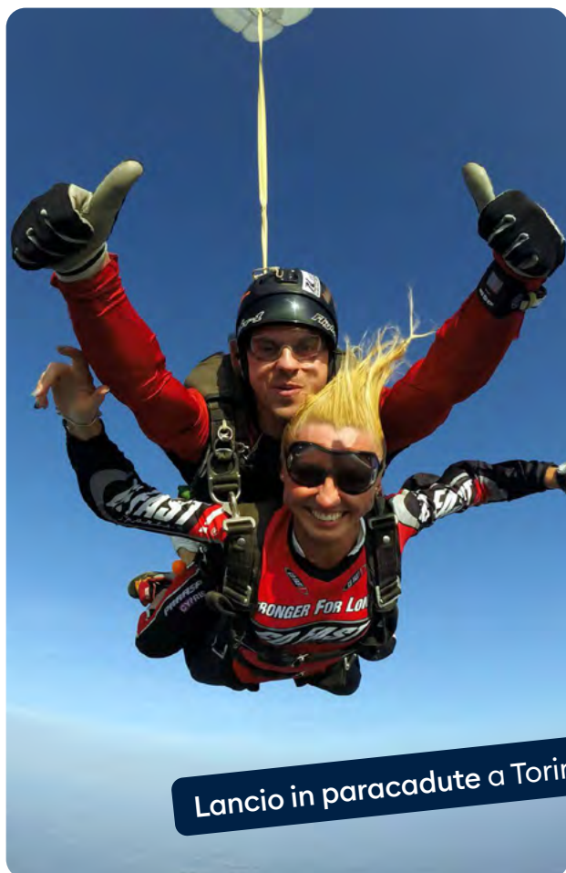
Lancio in paracadute a Torino

Diffusione di uno stile di vita attivo , salutare e orientato alla socialità, anche mediante la promozione di attività ed esperienze sportive, ricreative o turistiche, solitamente svolte in gruppo e/o all'aria aperta a contatto con la natura, iniziative culturali e/o a sostegno di enti del terzo settore o comunque non lucrativi. La promozione e l'offerta agli utenti di attività del tempo libero ha, come effetto principale, un miglioramento della qualità di vita dei partecipanti agli eventi. È del resto noto–e sottolineato dalle pubblicazioni e dai rapporti dell'Organizzazione Mondiale della Sanità–che lo svolgimento di attività fisica è utile per “mantenere e migliorare il benessere psicofisico, a ridurre i sintomi di ansia, stress, depressione e solitudine” . 1