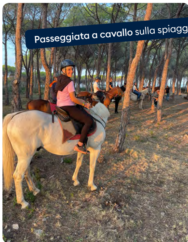
Passeggiata a cavallo sulla spiaggia