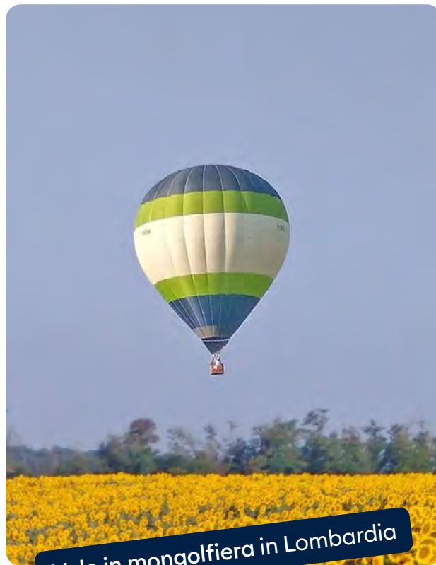
Volo in mongolfiera in Lombardia