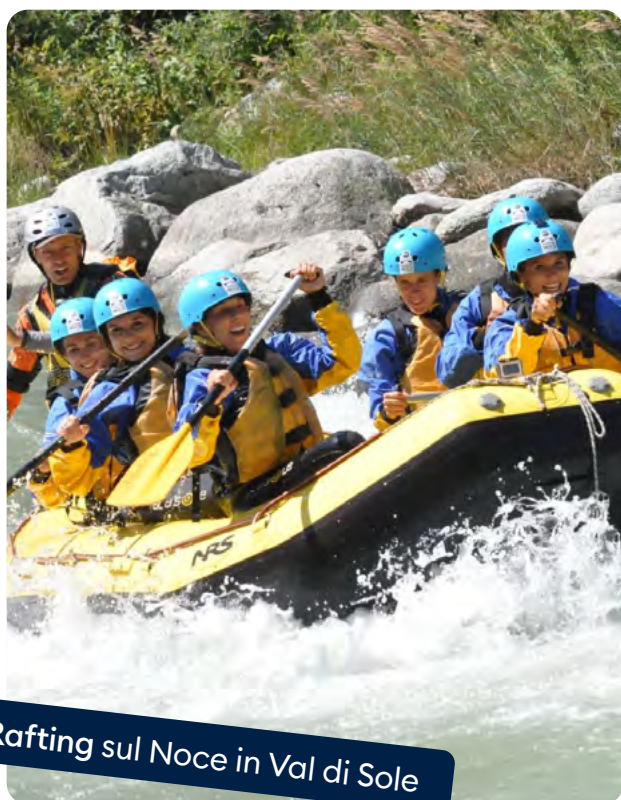
Rafting sul Noce in Val di Sole