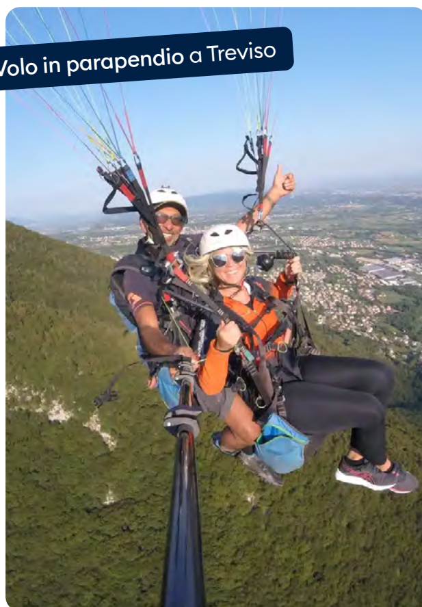
Volo in parapendio a Treviso

La Strategia nazionale ambisce ad invertire l'emorragia demografica di questi territori, valorizzandone le risorse naturali e culturali, così da creare anche opportunità di lavoro per i residenti .